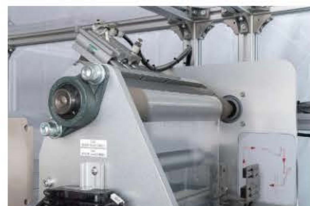
① フィルムのテンション制御