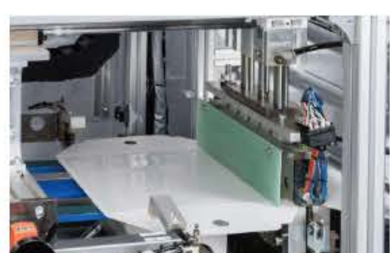
⑥ ヒートシール&フィルムカット部