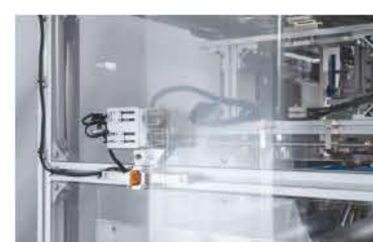
④ フィルム蛇行自動補正センサー