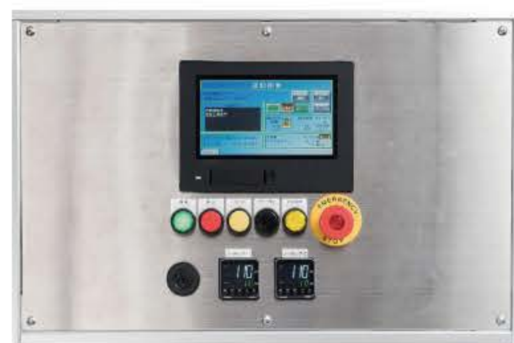
② スマートオペレーション