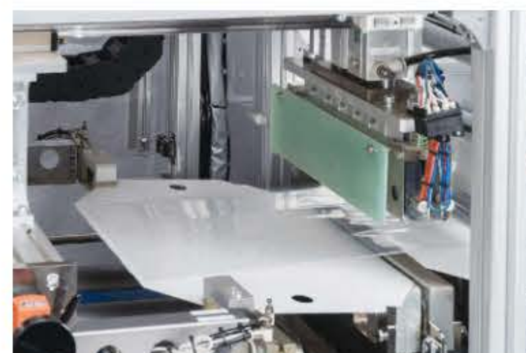
③ ポリオレフィン+段ボール+熱シール