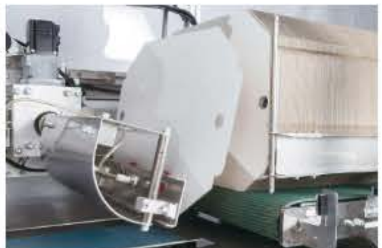
⑪ 段ボール引き抜き部