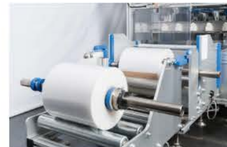
⑧ フィルム繰り出し部&フィルム原反補助台部