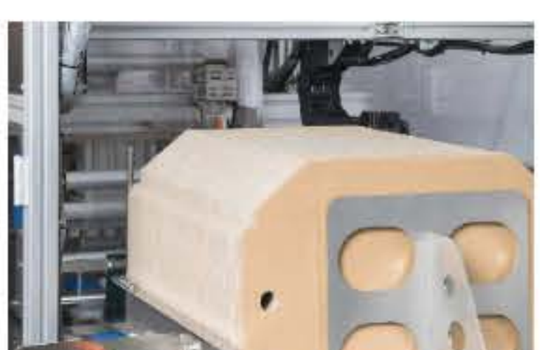
⑦ 段ボールマガジン